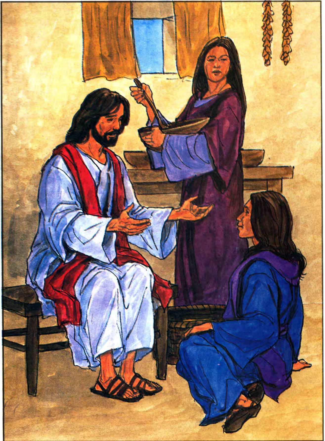
မာရိသည်ယေရှုပြောသမျှကို နားထောင်နေသည်။ မာသမှာမူ ချက်ပြုတ်ရန်ဝတ္တရားများဖြင့် မအားလပ်ပေ။