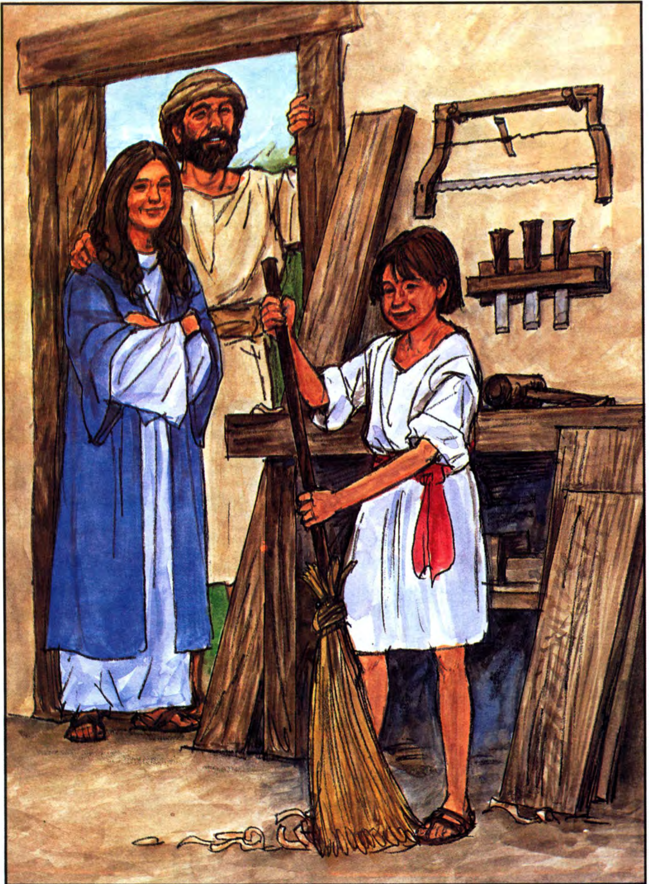
မိခင်မာရိနှင့် ဖခင်ယောသပ်ရှေ့တွင် ယေရှုတံမြက်စည်းလှည်းနေသည်။