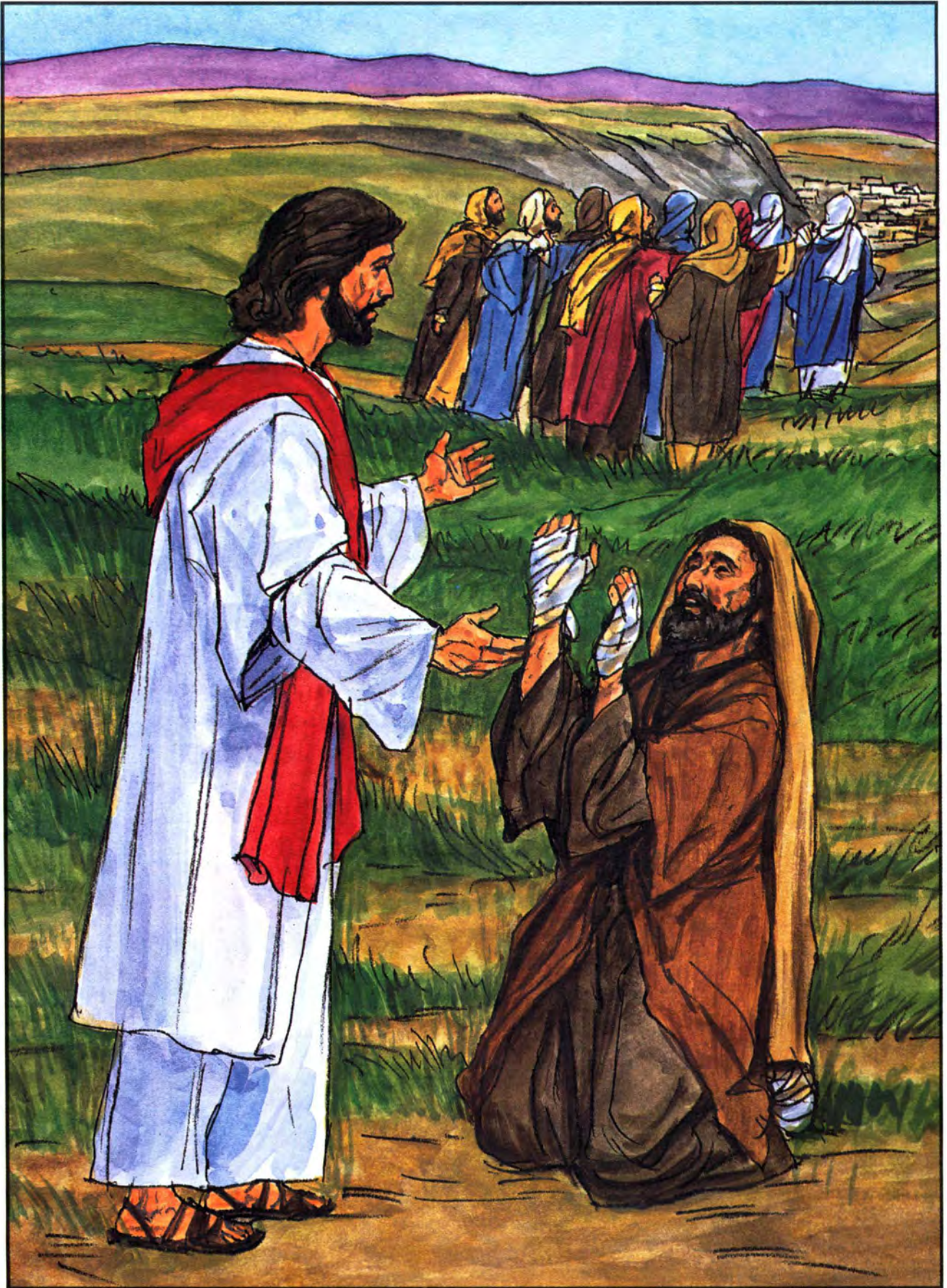
ရောဂါသည်များထဲမှတစ်ယောက်တည်းသာလျှင် ယေရှုထံပြန်၍ကျေးဇူးတော်ကိုချီးမွမ်းသည်။